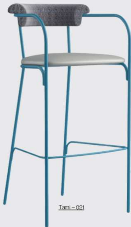
Tami - 021