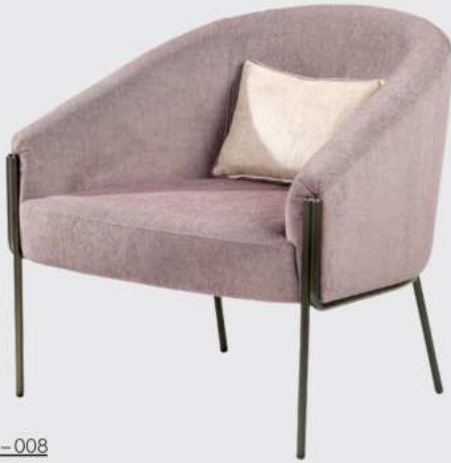
Vicky - 008