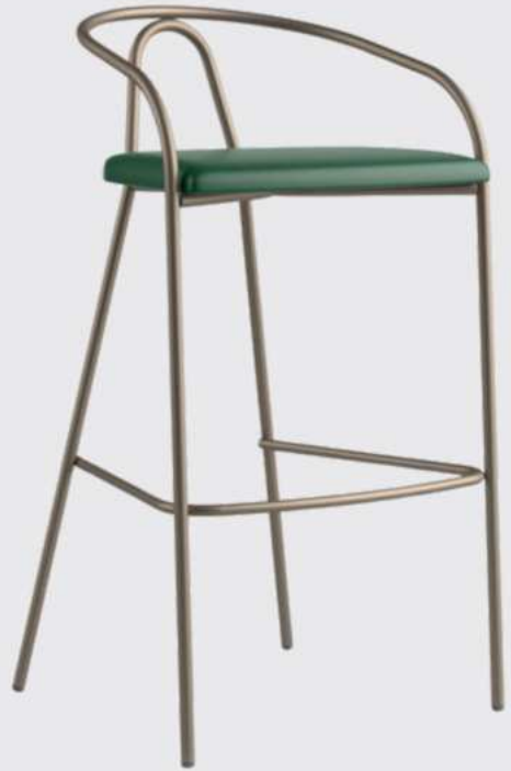
Vanina - 021