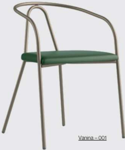
Vanina - 001