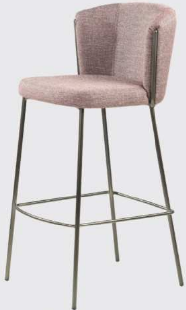
Vicky - 021