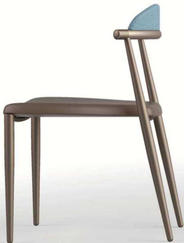
Mosarte - 001