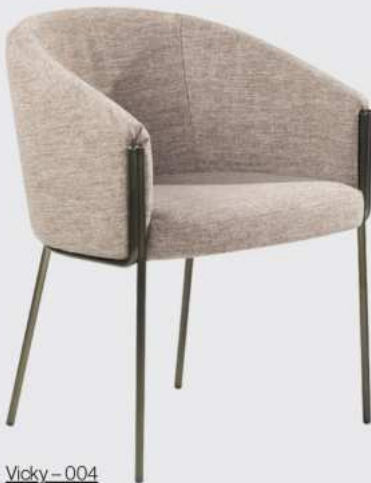
Vicky - 004

The function of design is letting design function.