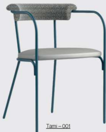
Tami - 001